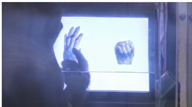
グーとパーのうち、パーを選ぶチンパンジー

かわる興味深い発見です。ヒトでよく見られる非直線的問題を解決する能力が、実はチンパンジーに「備わっている」のです。少なくともこの認知的能力という点でチンパンジーは4歳の子どもの同じくらい柔軟だということが分かりました。